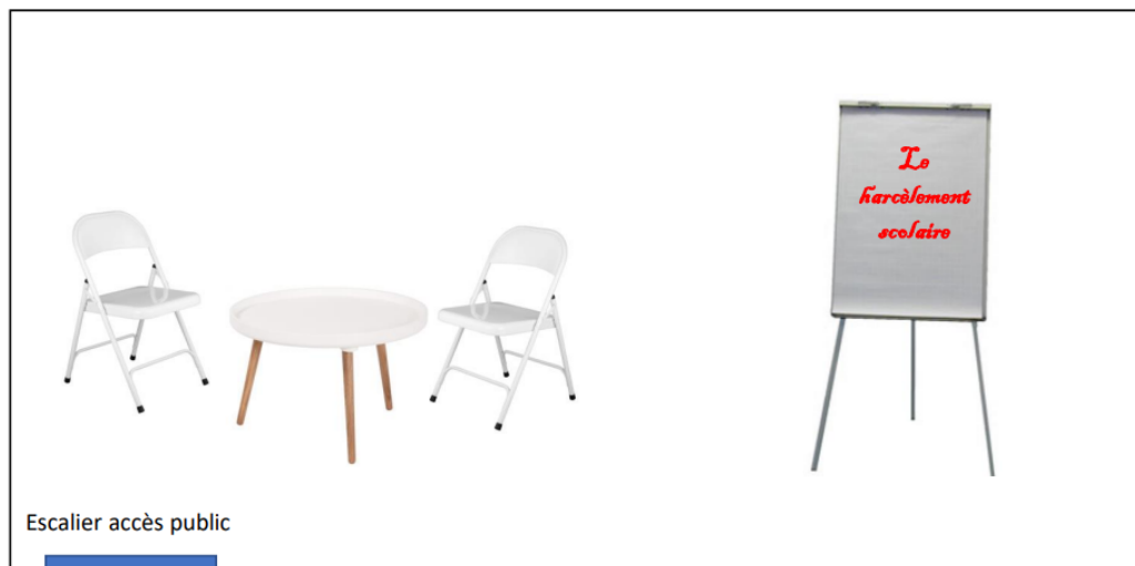
Schéma de l'installation de la scène et de la salle :

Le nombre d'élèves par intervention dépend avant tout de la capacité et également des équipements techniques de la salle. Toutefois, nous limitons à 120 élèves par représentation pour le bon déroulé du spectacle.